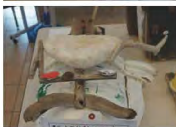
「ベッドでぐっすりおひるね」 糸藤華 2017年 銀賞