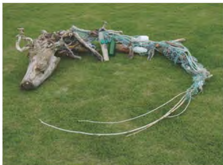
「波乗り」高橋 紗綾 (富山大学) 2017年 優秀賞

このアート展をきっかけとして、私たちの大切な海を守るために何をすべきか考え、みんなで行動してみませんか。