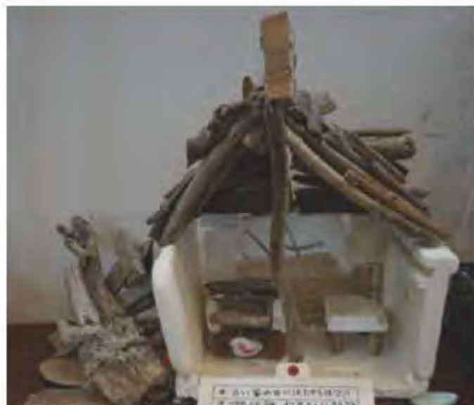
「古い家の中には、たからばこ!!!」 辻井杏奈・前澤優衣・西尾晴菜・七瀬遥菜・田中莉緒 2017年 金賞